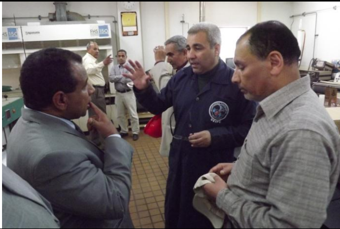
الزوار بمعمل الكيمياء