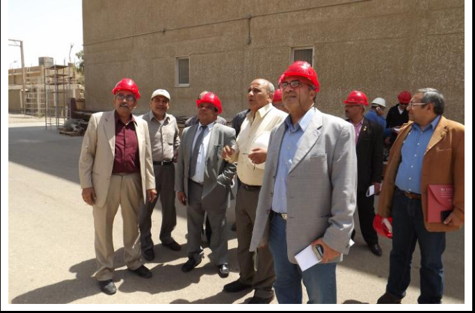
الزوار أمام أبراج الضغط العالي والمولدات