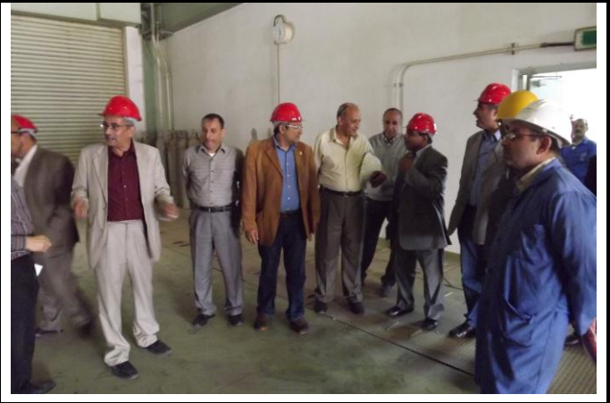
الزوار بمحطة المحولات