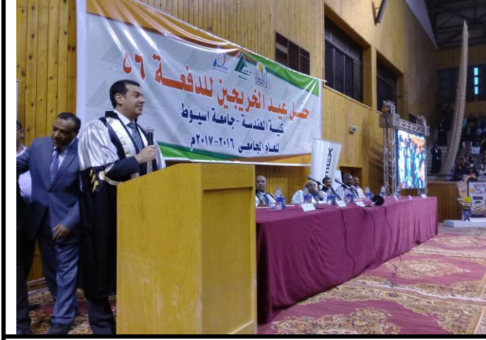
السيد الوزير المحافظ/ ياسر دسوقي يلقي كلمته