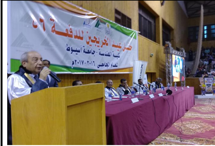
السيد المهندس/ طارق النبراوي نقيب المهندسين يلقي كلمته