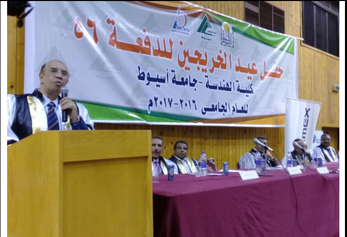
السيد أ.د/ أحمد عبده جعيس - رئيس الجامعة يلقي كلمته