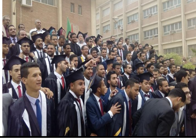
مجموعة من الخريجين