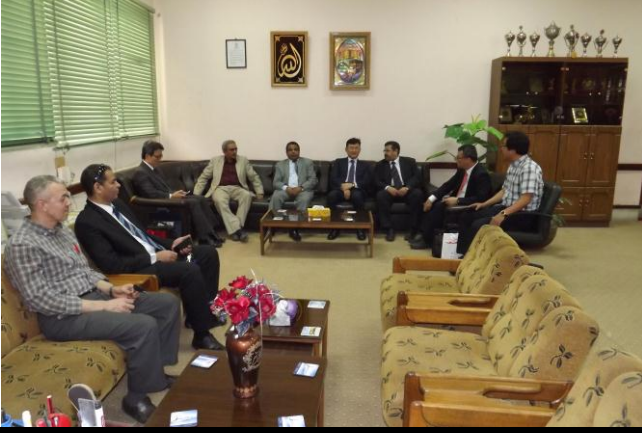
لقاء السيد السفير مع السادة الأساتذة بكلية الهندسة بمكتب العميد