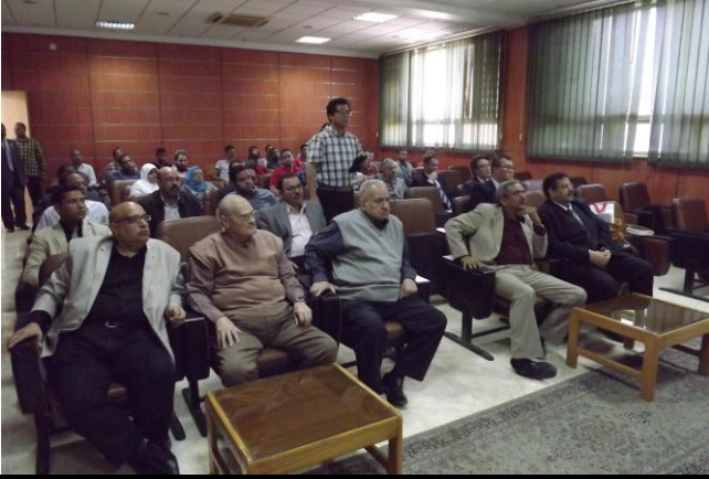
جانب من السادة الأساتذة الحضور أثناء اللقاء بالسيد السفير للعرض المرئي