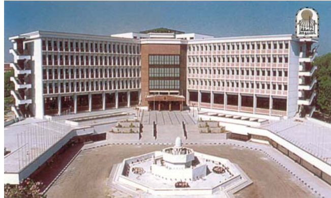
المبنى الإداري لجامعة أسيوط