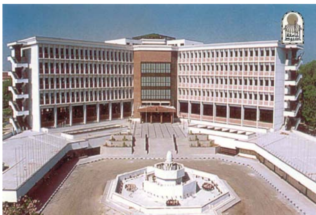
Административное здание Асьютского Университета