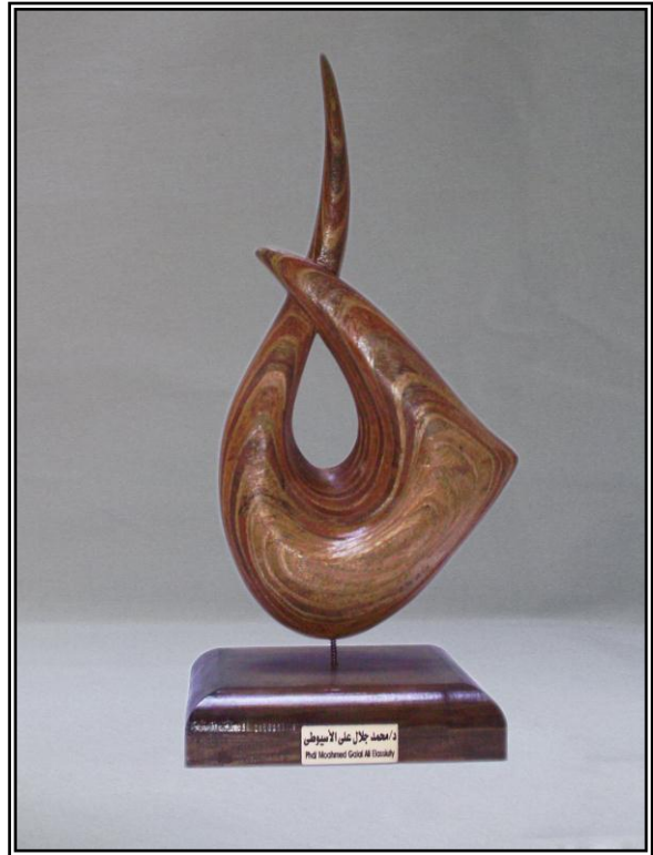
( حورية ) خشب أبلاكاج ٤مم ٢٧سم × ٩سم × ٥٠سم