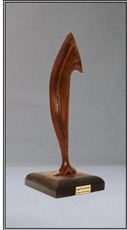
( صعود ) خشب أبلالكاج ٤مم ١٧سم × ٧سم × ٥٠سم