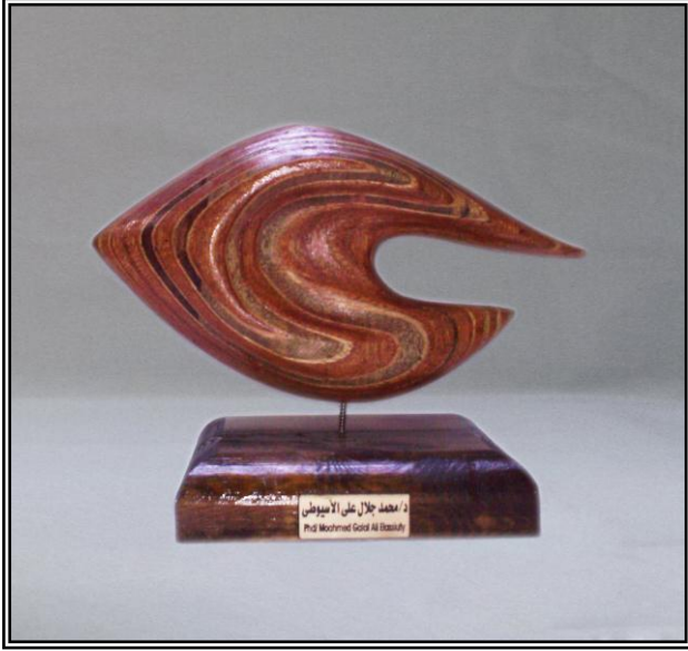
( إندفاع ) خشب أبلاج ٤مم ٣٠ سم × ٩ سم × ٣٨ سم