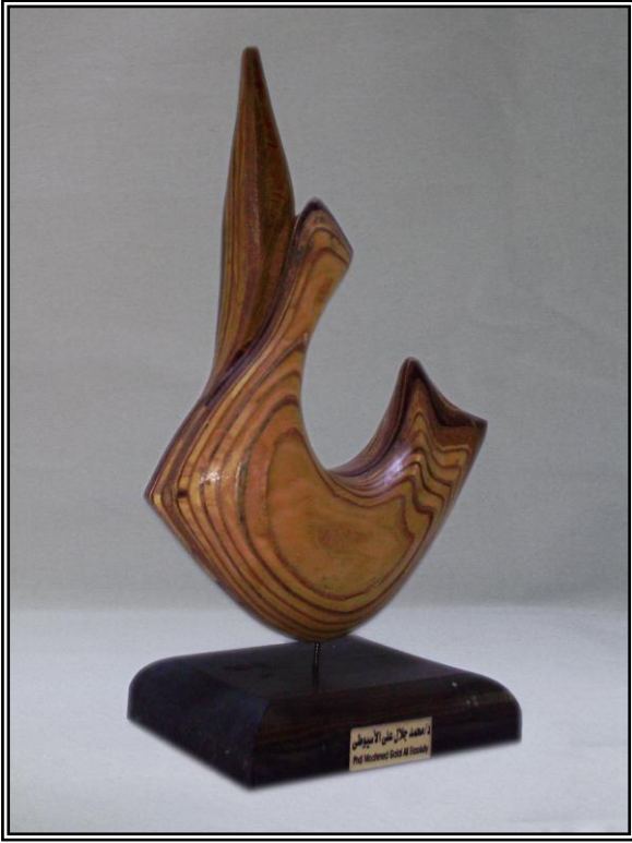
( إبحار ) خشب أبلاكاج ٩مم ٣٠سم × ١٢سم × ٥٠سم