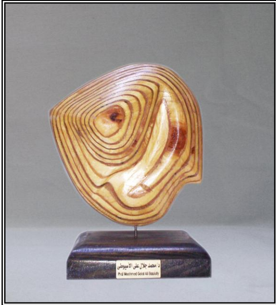
( دوامة ) خشب أبلاكاج ٩مم ٣٠سم × ١٧سم × ٣٨سم