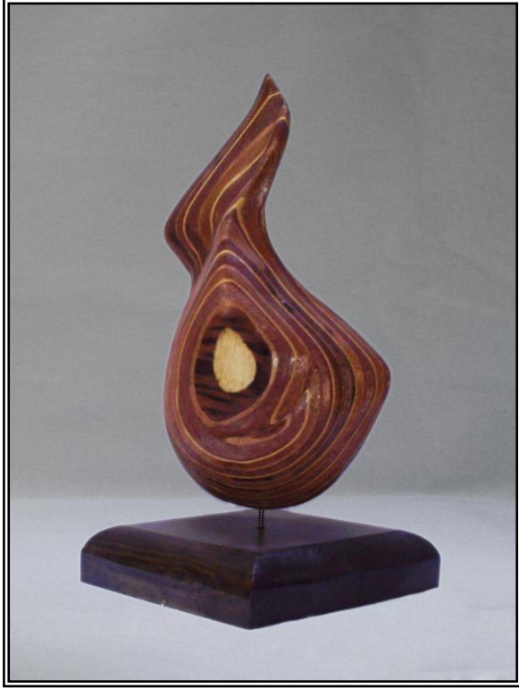
( سكون ) خشب أبلالكاج ٩مم ٢٢سم × ١٥سم × ٤٢سم