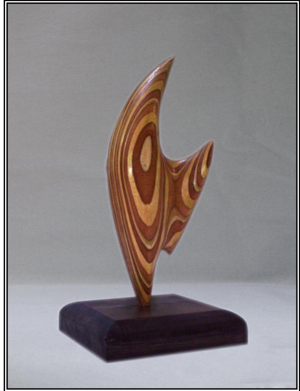
( إتجاه ) خشب أبلاكاج ٩مم ٢٠سم × ١٣سم × ٤٣سم