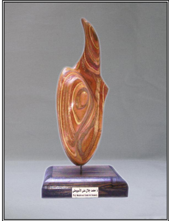
( إنتظار ) خشب أبلاكاج ٩مم ٢٥سم × ٣سم × ٥٣سم