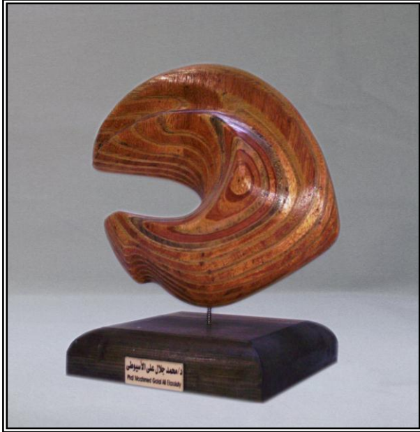
( ترقب ) خشب أبلاكاج ٤مم ٣٢سم × ٩سم × ٤٠سم