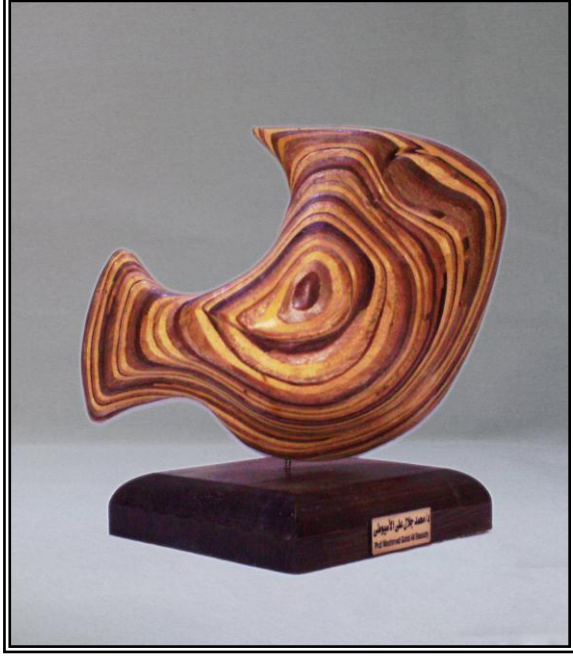
( موجه ) خشب أبلاكاج ٩مم ٣٨سم × ٤سم × ٣٨سم