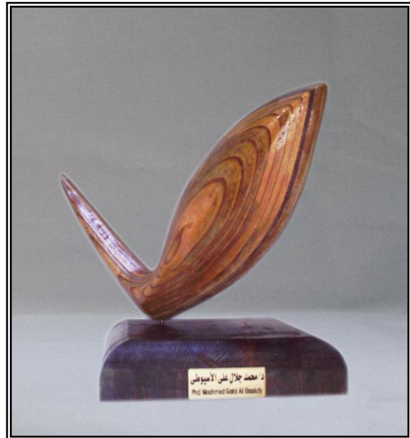
( إنطلاق ) خشب أبلاج ٤مم ٤٢ سم × ٩ سم × ٤٠ سم