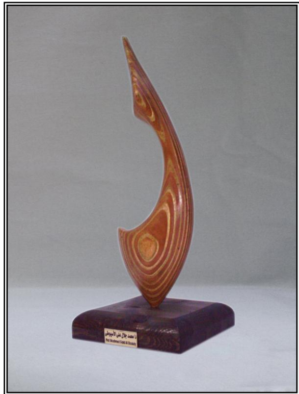
( رقصة ) خشب أبلاكاج ٤مم ١٨سم × ٨سم × ٥٠سم