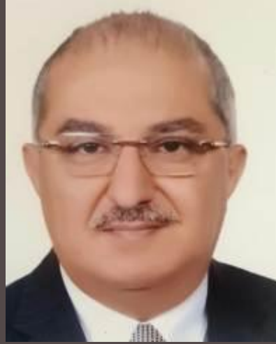
أ.د/ طارق الجمال رئيس الجامعة