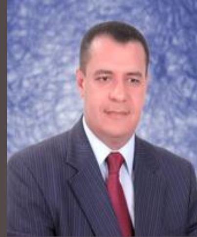
أ.د/ شحاته غريب نائب رئيس الجامعة لشئون التعليم والطلاب