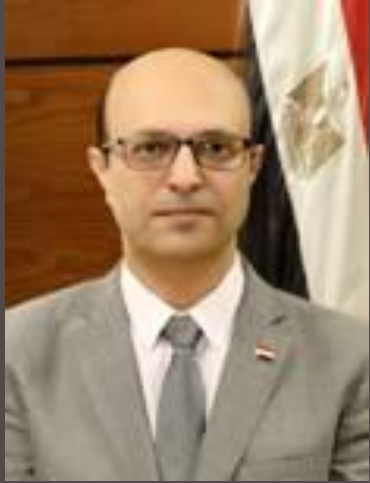
أ.د/ احمد المنشاوى نائب رئيس الجامعة للدراستات العليا و البحوث والمشرف على كلية الفنون الجميلة