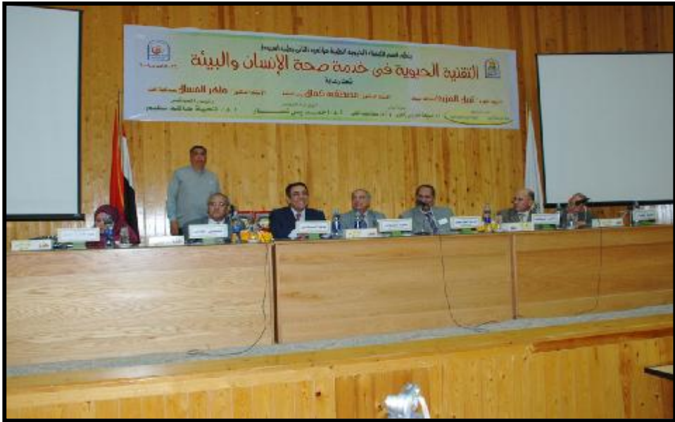
( مؤتمر قسم الكيمياء الحيوية الطبية )