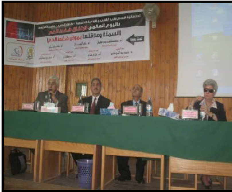
( ندوة عن السمنة وعلاقتها بضغط الدم )