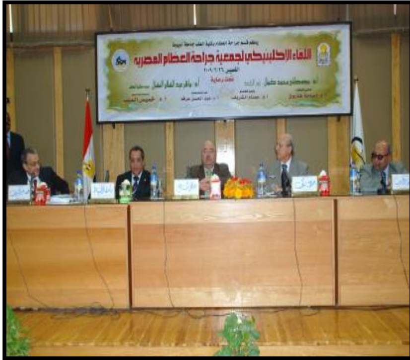
( اللقاء الإكلينيكي لجمعية جراحة العظام المصرية )