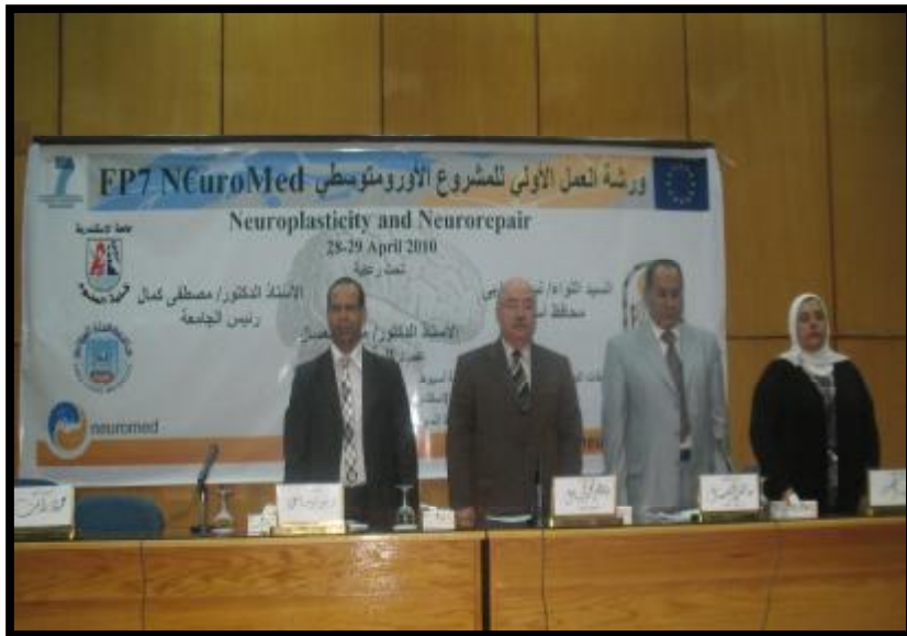
( ورشة العمل الأولى للمشروع الأورومتوسطي )