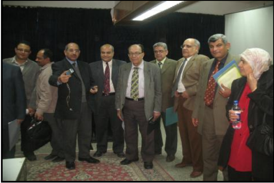
( مؤتمر وحدة الجهاز الهضمي بقسم الباطنة )