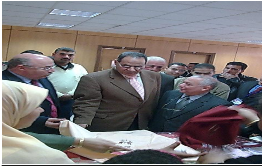
المعرض الخيري للملابس الجاهزة