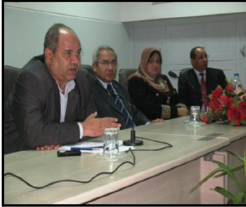
( ندوة إنفلونزا الخنازير )