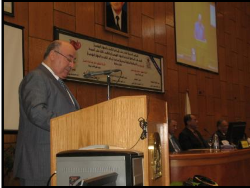
(المؤتمر الثاني عشر لقسم طب الجهاز الهضمي)