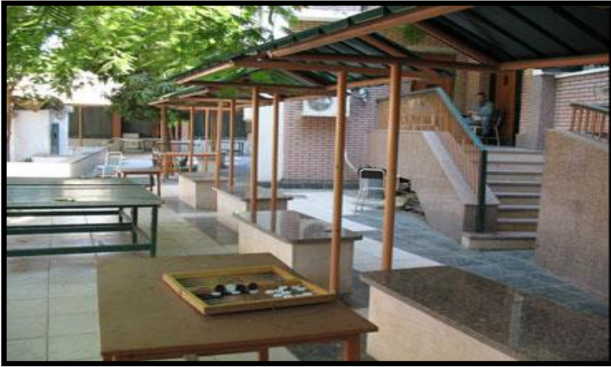
النادي الاجتماعي لمرضي الإدمان والطب النفسي