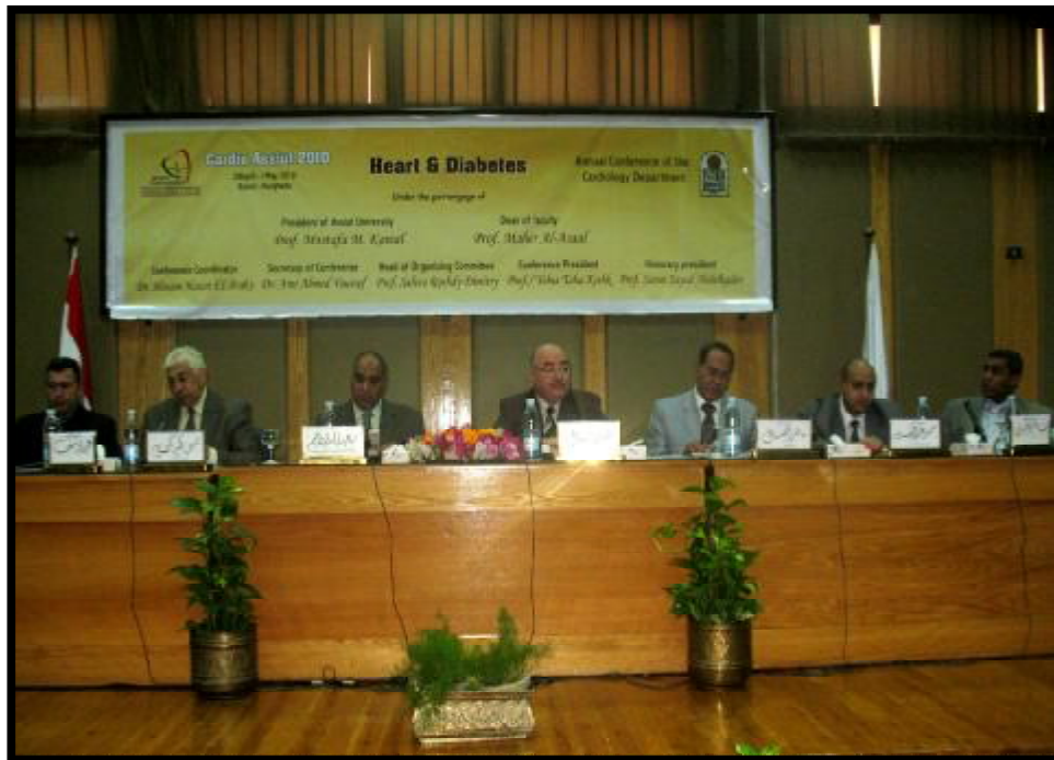
(مؤتمر طب القلب والأوعية الدموية)