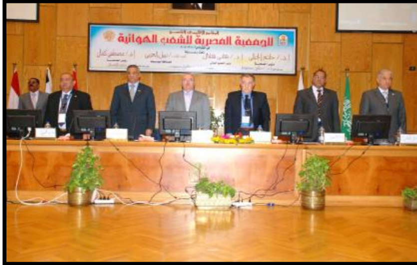
(مؤتمر الجمعية المصرية للشعب الهوائية)