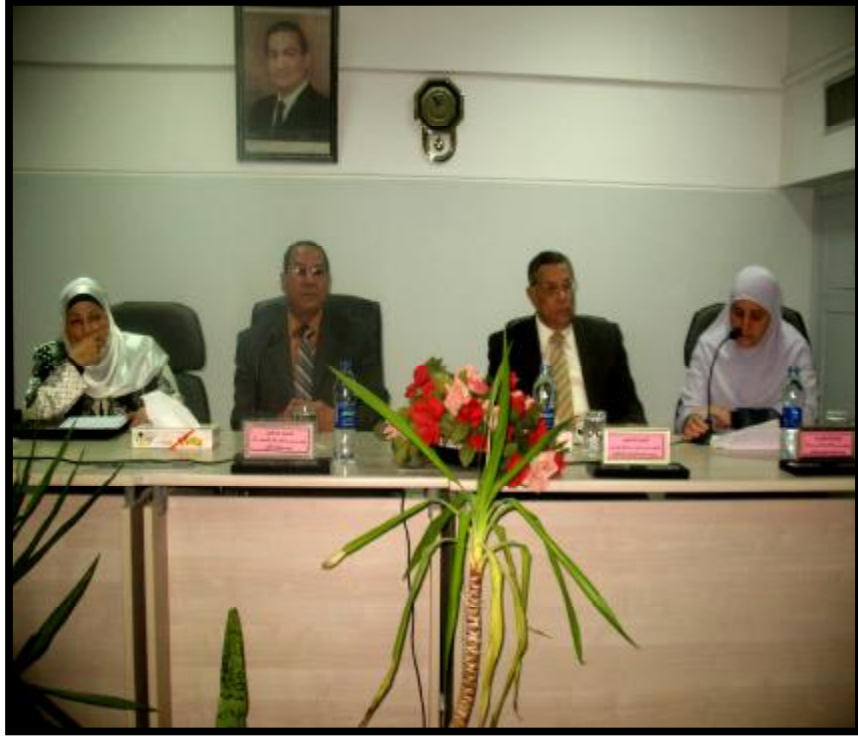
( ندوة مناظير الجهاز الهضمي )