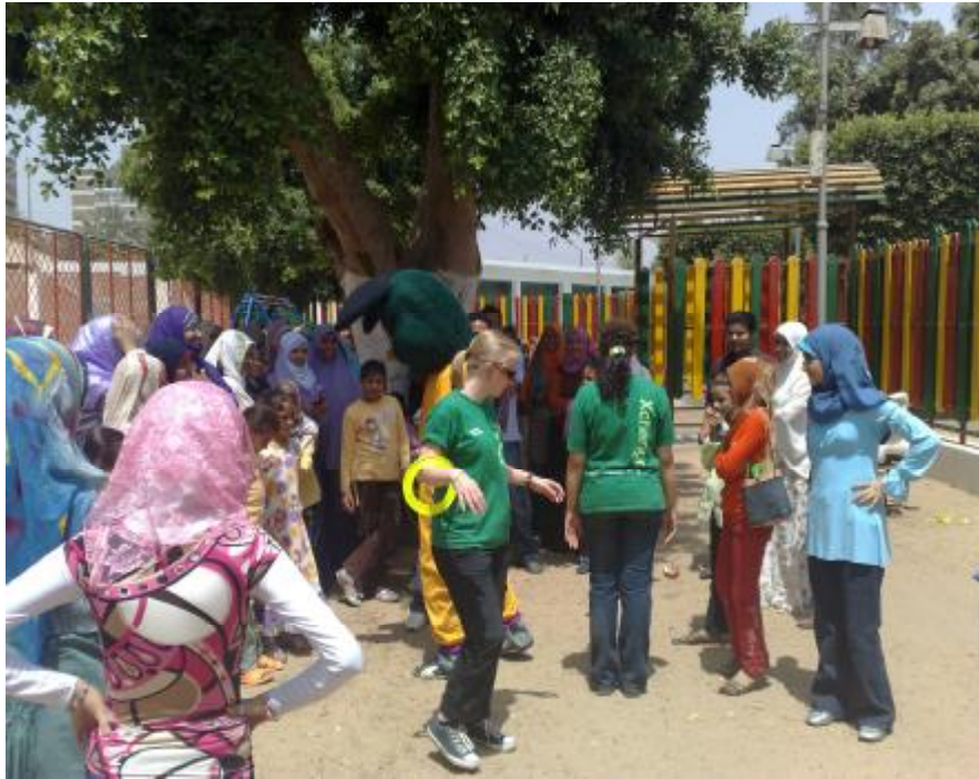
الحفل الترفيهي للأطفال الأيتام بنادي أعضاء هيئة التدريس يوم ٢٠٠٩/٤/١٧