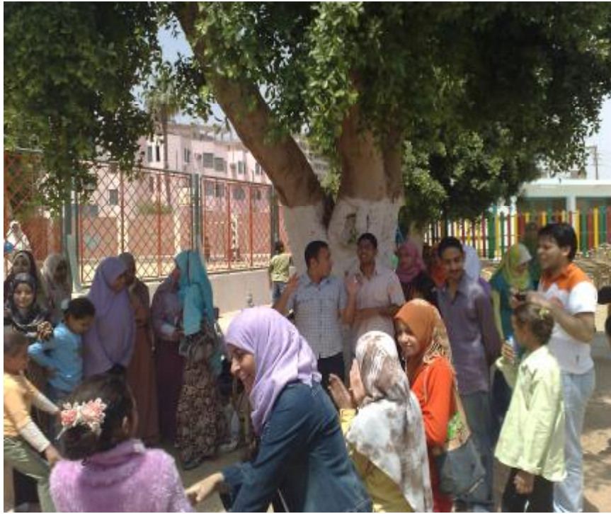
الحفل الترفيهي للأطفال الأيتام بنادي أعضاء هيئة التدريس يوم ٢٠٠٩/١١/١٣