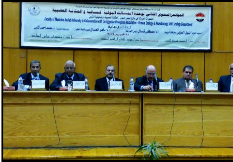
(المؤتمر السنوي الثاني لوحة المسالك البولية النسائية والمثانة العصبية)