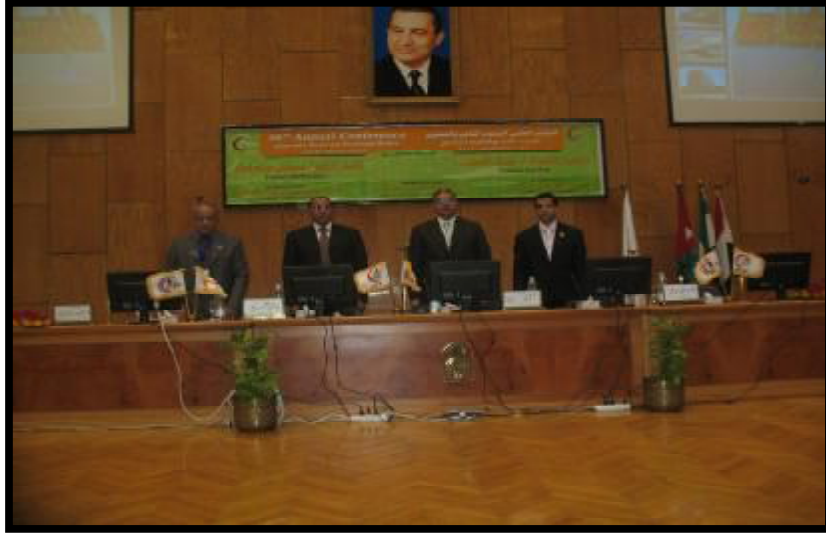
( المؤتمر الثامن والعشرون للكلية )