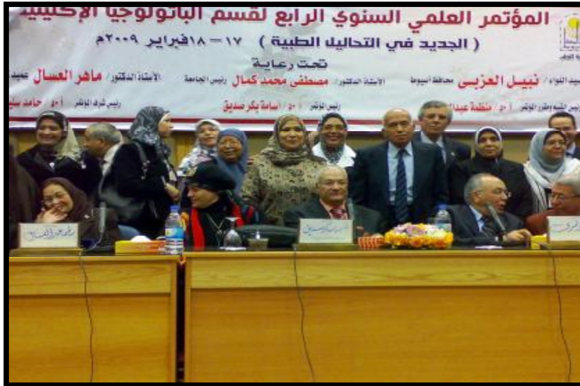
( المؤتمر العلمي السنوي الرابع لقسم الباثولوجيا الإكلينيكية )