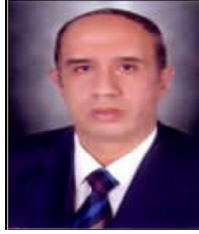
الأستاذ الدكتور أحمد عبده جعيس رئيس الجامعة