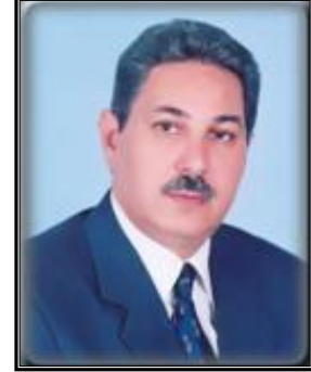
الأستاذ الدكتور عصام محمد أحمد نائب رئيس الجامعة لشئون التعليم والطلاب